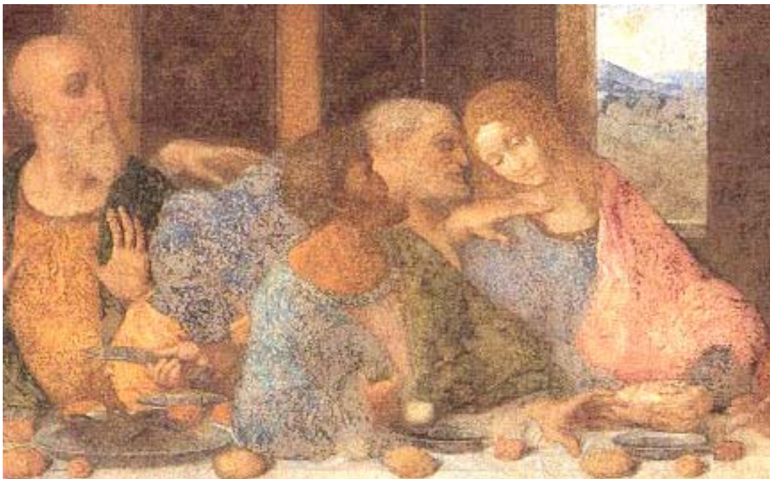
Figura 5 - particolare ( Giuda-Pietro-Giovanni)

Ora questo buio che c’è sul volto di Giuda, cui accennavo prima, non è un buio che si spiega esteriormente: è un buio che nasce dall’anima. Se avete fatto attenzione mentre leggevo il passo del vangelo scelto da Leonardo per rappresentare il suo Cenacolo, avrete notato che alla fine l’evangelista dice: “ Era notte ”. Giuda uscì fuori, ed era notte . E’ chiaro che era notte, siamo durante la cena della Pasqua ebraica...perché precisarlo?