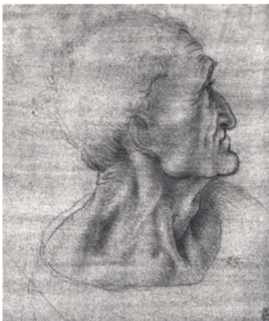
Figura 8 - studio sul volto di Giuda

L'ottava postazione è quella di Giuda, lo Scorpione . La posizione dei suoi arti superiori ricorda le chele aperte e, a ben guardare, il coltello in mano a Pietro sembra l'aculeo velenoso che esce dalla schiena dello scorpione-Giuda . Anche se questo coltello è in mano a Pietro, sembra appartenere a Giuda e l'intera raffigurazione sembra essere un tutt'uno. In fondo quando una persona commette un omicidio è l'intenzione, è l'animo che decide: è lì che si commette il reato, ancor prima che la mano che lo realizzerà si muova. Uno che sta pulendo un'arma da fuoco può sparare accidentalmente ed ammazzare una persona, ma certo in questo caso non si può affermare che costui intendesse uccidere. In questa prospettiva, tornando alla nostra rappresentazione, è più giusto che il coltello sia in mano a Pietro -che rappresenta i moti dell'anima- come accennavo poco fa. Possiamo vedere questo "arto con il coltello" anche come il braccio operativo e quindi appartenente all'elemento corpo fisico ; da questo punto di vista diventa l'aculeo dello scorpione-Giuda appunto (che nello schema 1 di pag. 15 è in relazione con l'elemento corporeo dell'essere umano).