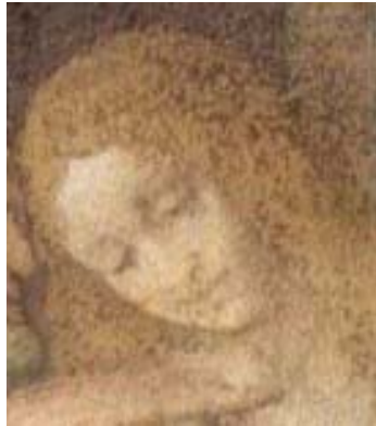
Figura 10 - particolare (volto di Giovanni)

Perché Giovanni è il più spirituale – ne ho parlato più volte durante la conferenza - e lo spirito non ha sesso. Lo spirito è polare alla materia, per cui se nella materia c'è il massimo della differenziazione - che si evidenzia nell'esistenza dei due sessi -, nello spirito c'è invece il massimo di unità e sarebbe come discutere del sesso degli angeli. Che sesso hanno gli angeli? Sono uomini o donne? Leonardo, che si è sforzato di rappresentare col pennello dei veri e propri archetipi, crea Giovanni – il più affine al Cristo - con un volto di una dolcezza infinita, un volto che può sembrare sia femminile sia maschile.