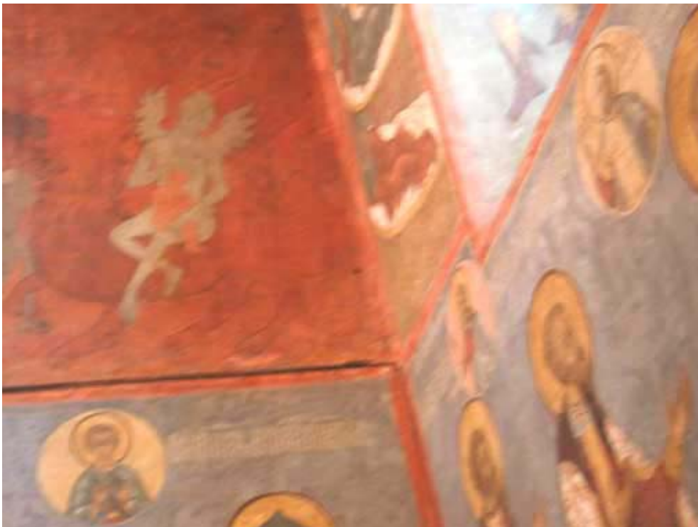
Figura 4 – L'anima di Giuda in braccio a Satana (cattedrale di San Michele, Mosca)

Osservando il Cenacolo di Santa Maria delle Grazie vediamo però una cosa interessantissima: Leonardo non isola Giuda! Lo inserisce in mezzo agli altri undici. Non ci sono aureole, non ci sono dei più buoni . Ci sono esseri umani. In un certo qual modo è come se Leonardo non condannasse a priori Giuda, ma dicesse: guardate che egli è un essere umano come noi tutti; guardate che buoni e cattivi siamo tutti. In fondo Leonardo, sottolineando il mistero di Giuda, ci riporta al mistero del male e del destino individuale di ognuno, visto che l'azione di Giuda è stata poi trasformata dal Cristo in una benedizione per tutta la Terra, attraverso il mistero del Golgota.