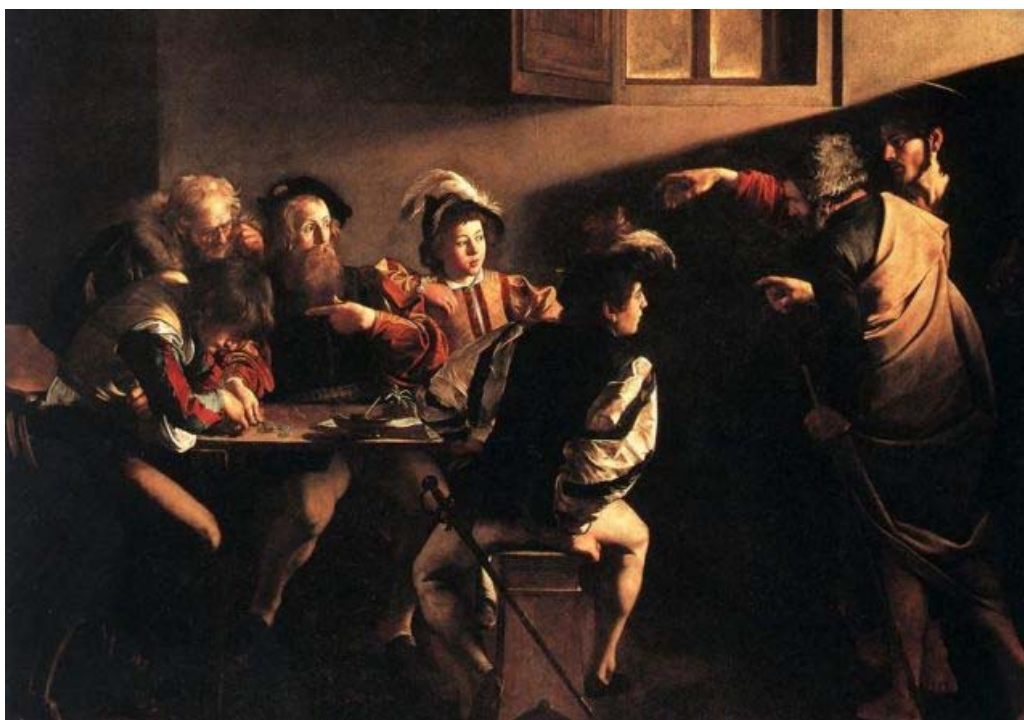
Figura 1 - "La vocazione di Matteo" (Chiesa di San Luigi de' Francesi, Roma)

Leonardo non si sarebbe mai sognato di dipingere il Cristo così, messo in un angolo, in disparte, al buio. L'Essere del Sole al buio.