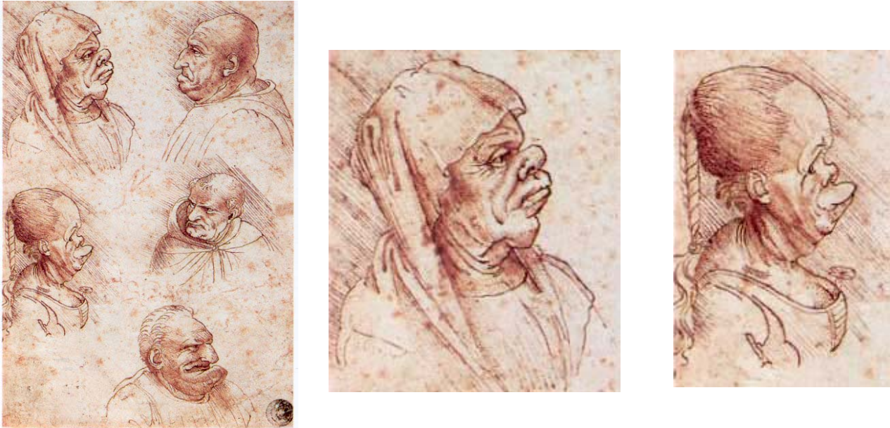
Figura 2 – caricature - (Accademia, Venezia)

Ecco alcune immagini di caricature fatte dal genio toscano.