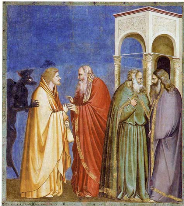
Figura 6 - Giotto - Il tradimento di Giuda (Cappella degli Scrovegni, Padova)

Vediamo per esempio come Giotto, nella Cappella degli Scrovegni, dipinga Giuda che va al sinedrio per tradire Gesù Cristo, e come in realtà sia Satana che lo porta per le spalle come se fosse un manichino, come se non fosse più Giuda ad agire (vedi fig.6). Ormai ridotto ad una carcassa, ad una sembianza di uomo, come già morto interiormente, Giuda si fa muovere da forze estranee a lui... un impossessato per usare un termine tradizionale.