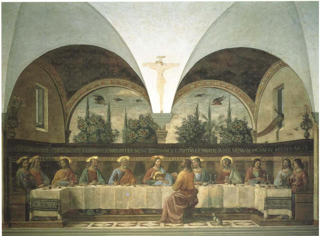
Figura 3 - Cenacolo del Ghirlandaio ( Museo San Marco, Firenze)

Vi ho portato questo cenacolo del Ghirlandaio (vedi fig.3)